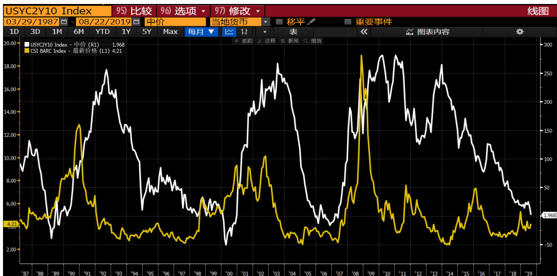
图 2，美国两年期与十年期国债利差（白线），美国信用利差（企业债收益率-十年期国债，黄线）