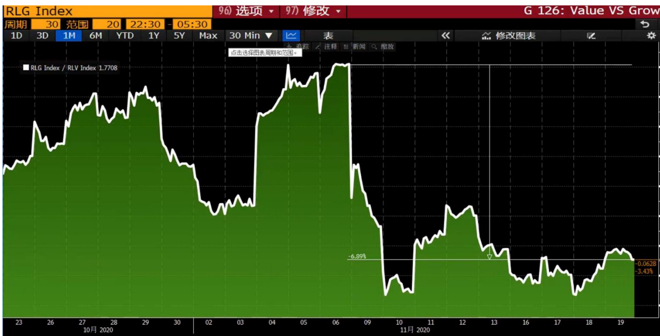
图表 2 成长股/价值股