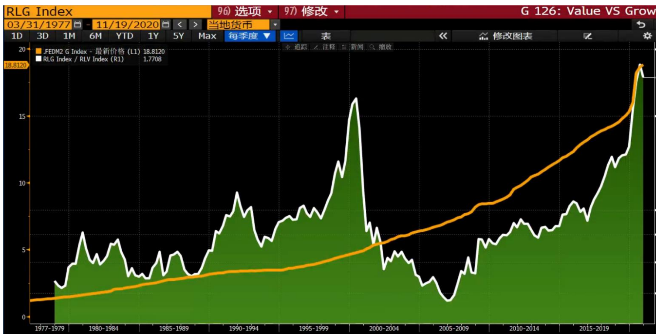
图表 5 成长股/价值股；全球货币供应总量