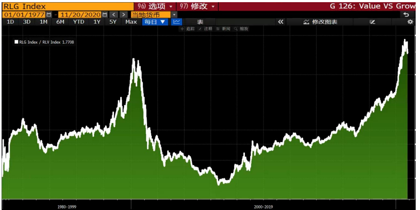
图表 1 成长股/价值股